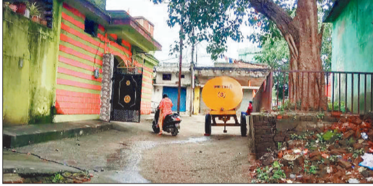
मोहल्ले में टैंकर से हो रही सप्लाई।

नगर निगम की मानें तो गर्मी को देखते हुए शहर के भीतर मौजूद सभी 11 पानी टैंकों से सुबह और शाम को पूरी क्षमता से जलापूर्ति की जा रही है। किंतु कुछ इलाके ऐसे हैं जहां अमृत मिशन के तहत लगे हुए नलों की धार पतली हो चुकी है। शीघ्र ऋतु से पहले जहां डेढ़ से दो घंटे तक पानी आता था, लेकिन अब आधे घंटे तक ही पानी आता है और यदि इस बीच बिजली गुल हो जाए तो पानी से वंचित होना पड़ जाता है। बीते कुछ दिनों से सुबह और शाम दोनों समय बिजली कटौती की जा रही है, ऐसे में अमृत मिशन के नलों से