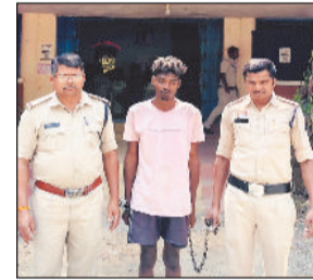
पिता ने घर से भागकर बचाई जान, रैरूमाखुर्द चौकी क्षेत्र का मामला

यह मामला रैरूमाखुर्द पुलिस चौकी क्षेत्र का है जहां पारिवारिक विवाद ने एक खोनाक मोड़ ले लिया, जहां एक बेटे ने अपनी ही मां की फावड़े से इसलिए हत्या कर दी, क्योंकि परिवार में उसके अन्य भाई-बहनों की तुलना में उसकी पूछपछ कम होती थी। इसी बात से नाराज युवक ने फावड़े से जोरदार वार अपनी ही मां की हत्या कर दी। युवक के सिर पर सवार गुरसे को देख वहां खड़े उसके पिता ने किसी तरह घर से बाहर भाग कर अपनी जान बचाई। वहीं इस बीच पुलिस को इस घटना की सूचना दी गई। जिसके बाद ने मौके पर पहुंच कर आरोपी आरोपी को गिरफ्तार कर लिया।