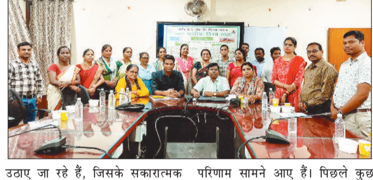
उठाए जा रहे हैं, जिसके सकारात्मक परिणाम सामने आए हैं। पिछले कुछ